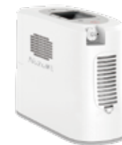
バッテリー付き本体