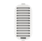
空気取入口フィルタ