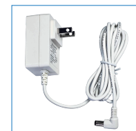
専用 AC アダプター