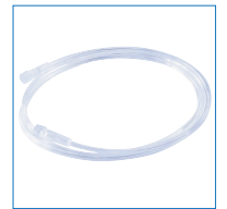
ネブライザーホース