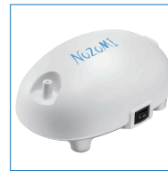
コンプレッサー式 ネブライザ (本体)