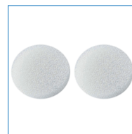
エアフィルター (予備 2 個)