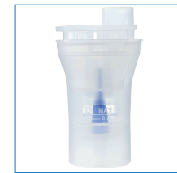
ネブライザーキット